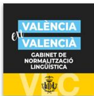
Imatge de perfil per a xarxes