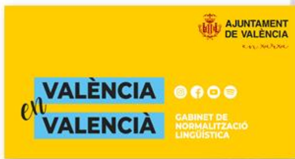
Capçalera per a xarxes (Facebook i YouTube)